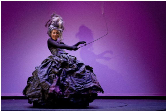
Theater Pfütze, 2012

Stellt den anderen Gruppen im Anschluss eure Ergebnisse vor und diskutiert gegebenenfalls darüber.